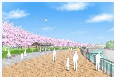
川沿いの桜並木のイメージ