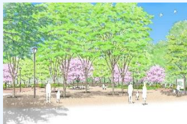
エントランス交流ゾーンのイメージ