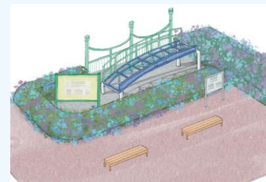
広場の完成予想イメージ