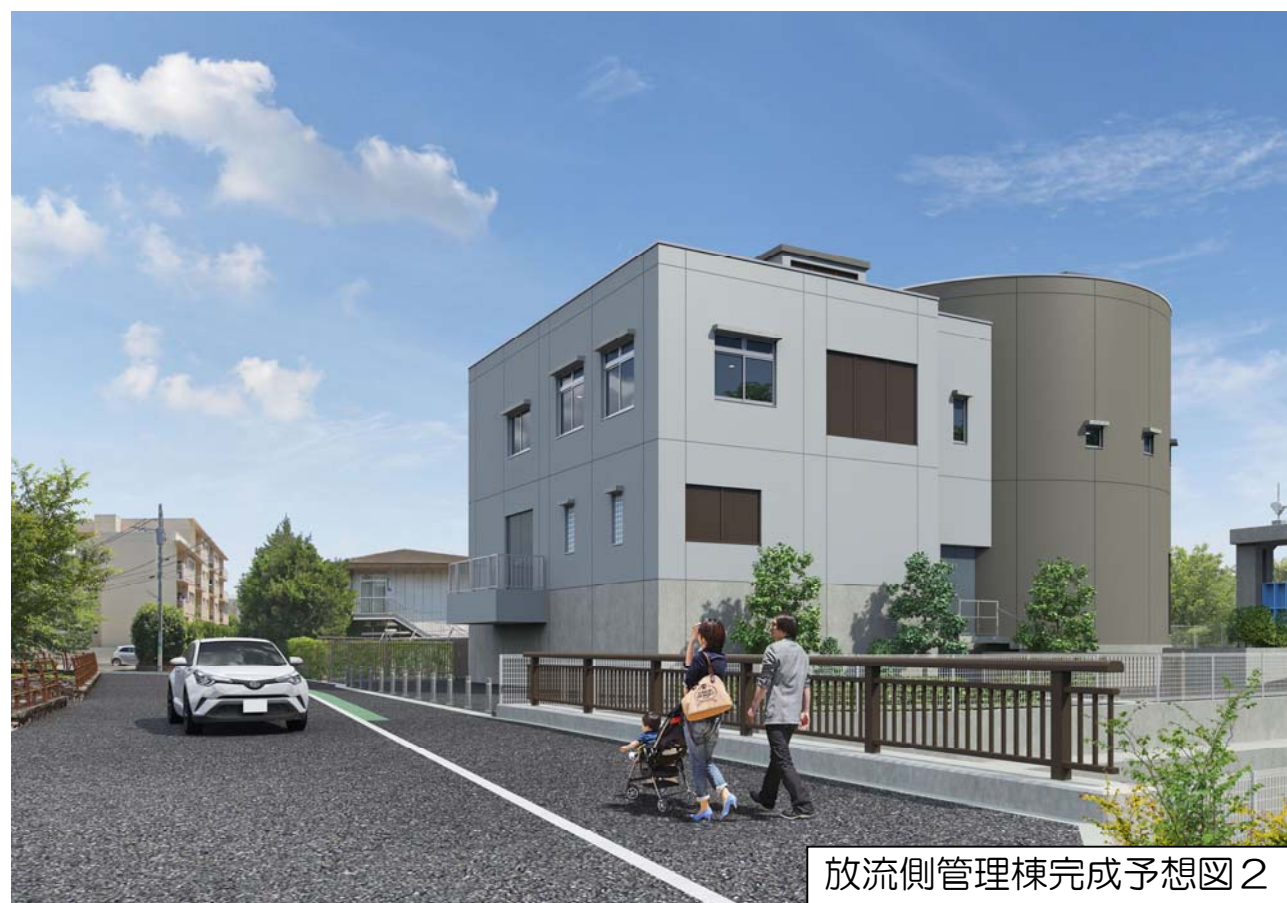
放流側管理棟完成予想図2