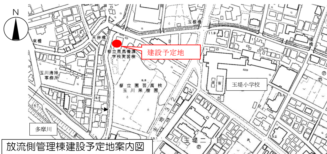
放流側管理棟建設予定地案内図