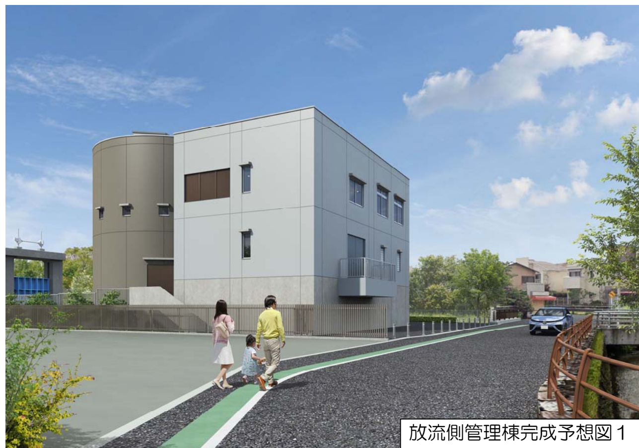
放流側管理棟完成予想図1