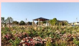
四季折々の花が楽しめます