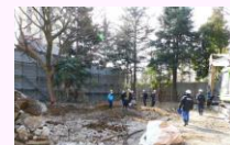
撤去状況(豊島園事務所)