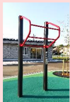
ぶら下がりや 懸垂で筋力向上に