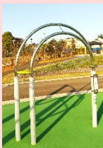
腕・肩の 柔軟性アップに