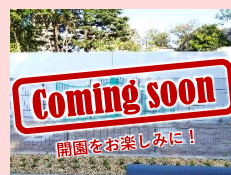
としまえんの 施設を展示