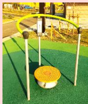
体をひねって 腰のストレッチに