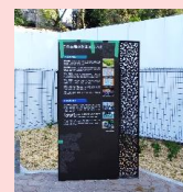
土地の思い出を 紹介する解説板