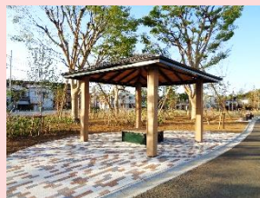
横幕を張ると救護室などになる あずまや