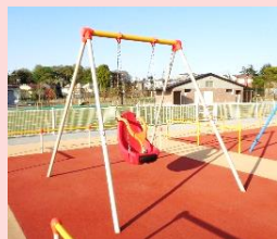
ちい 小さいも遊べる サポート付きブランコ