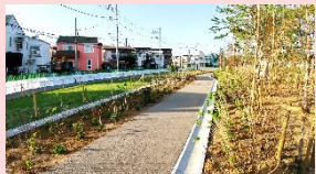
新芽が出てきているアジサイ