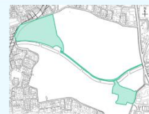
着色箇所が、5月1日開園範囲です。

いよいよ5月1日、東京都立練馬城址公園が開園します！ 今回のかわら版では、園内のみどころを一足早くご紹介します。