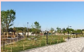
サクラがいっぱいの広場