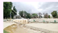
撤去状況(ナイアガラプール)

前号でお知らせしましたが、石神井川南側のエリアについては、令和5年度末まで、既存施設の解体撤去工事を実施します。工事に伴い、近隣にお住まいの皆様にはご迷惑をおかけいたしますが、今後も騒音や振動、土埃等に配慮しながら工事を進めていきますので、ご理解、ご協力をよろしくお願いいたします。