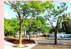
豊島園駅に近い公園入口