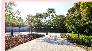
来園者を出迎えてくれる 樹木や花々