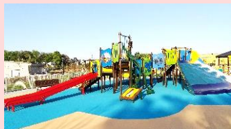
あそ かと ふくごうゆうく 遊び方いろいろの複合遊具