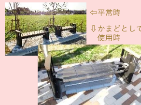
⇄ 平常時 ↓ かまどとして 使用時 煮炊きができる かまどベンチ・野外卓