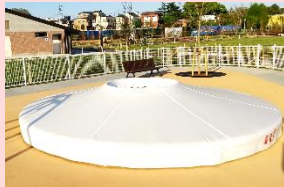
しろ 白くてふわふわトランポリン