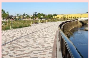
川辺を散歩できる 広々とした園路等