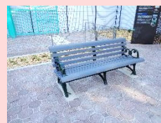
舗装やベンチも としまえんのもの