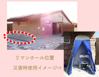
↑ マンホール位置 災害時使用イメージ⇨ 水・電気が止まっても使用できる マンホールトイレ