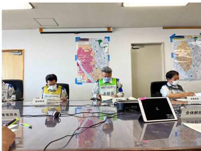
災害対策本部会議の様子