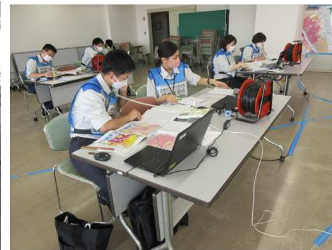
住民からの問い合わせ対応