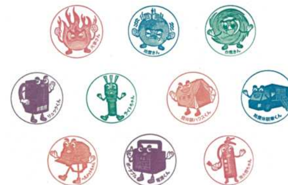
【スタンプデザイン】