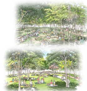
「誇りの杜」イメージ

・杜を健全に保つため、管理と自然の生育を組み合わせ「時間の経過と共に変化する生態ゾーン」を「フォレストコア」として位置づけ、形成を促します。杜に現われる複数のフォレストコアは、人、生き物、あるいは建築やまちとの関わり方をデザインすることにより、杜づくりの新たな指標とします。