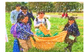
参加型防災体験学習プログラム

私たちは、事故・災害発生時には、各種分野の協力団体とともに、安全確保、被害の最小化に全力で対応します。そして地域防災力の向上にむけて、東京都・各自治体・警察・消防等との連携体制はもちろんのこと、地域住民と連携して、公園での防災活動をきっかけとして誰もが安全に安心して過せる地域づくりを共に行っていきます。