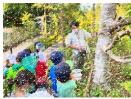
イベント例 もりの探検隊(ののおやま)