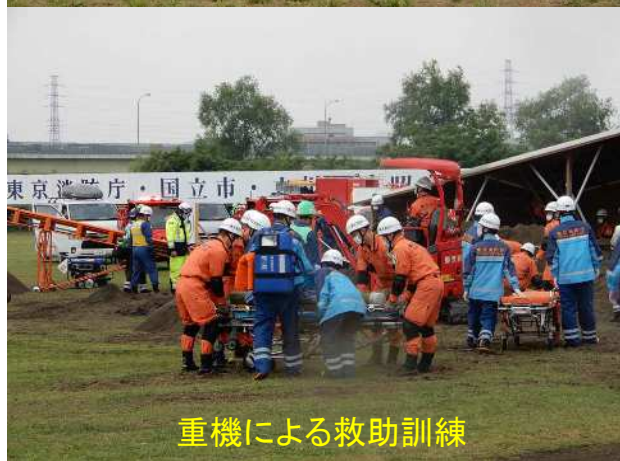
重機による救助訓練