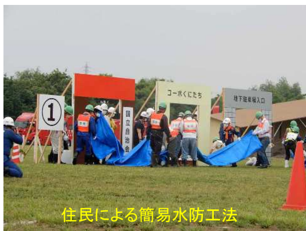
住民による簡易水防工法