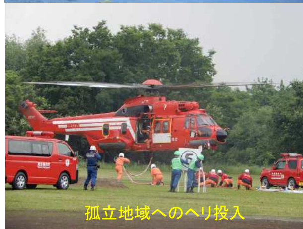
孤立地域へのヘリ投入