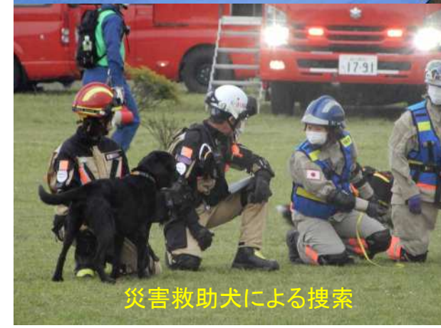
災害救助犬による搜索