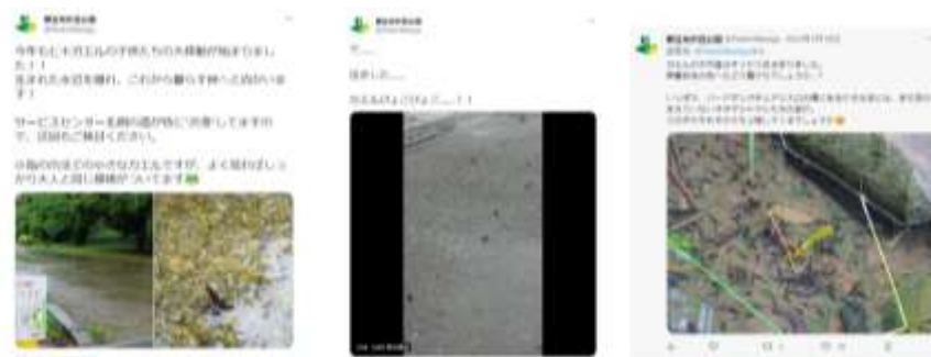
図6. 光が丘公園名物ヒキガエルの大移動（公園公式 twitter 引用）

さらに、今年度からは観察舎が閉園している日でも園内の生き物観察を楽しんでもらえるよう、配布用のセルフガイドリーフレットの作成を始めた。第一弾としてTwitterで配信して人気のあった「ヒキガエル」版が間もなく完成し、配布予定である。