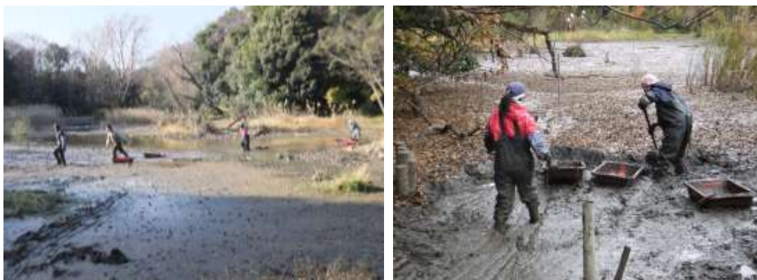
図7. かいぼり中のバードサンクチュアリ池と底泥除去の様子（1月）

バードサンクチュアリ池では、さまざまな生き物に住処を提供するため、作業区域、実施時期・回数を決めて、底泥の除去（かいぼり）を実施し、水域内にさまざまな遷移段階を成立させている。今年度もヒメガマの茂みでカイツブリの繁殖が確認されるなど、良好な水辺植生が保たれている。