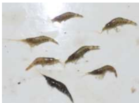
図9. 増加傾向にある外来エビ