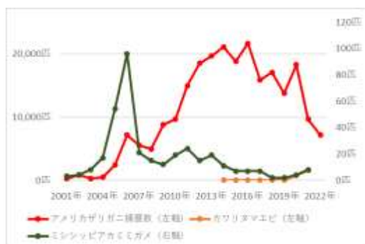
図8. 外来種捕獲数の推移

また、ここ数年アライグマの出現を確認しており、今年度からセンサカメラによるモニタリングを開始した。その結果、4月から11月までの間に7回の出現を確認した。なお、センサカメラで確認した後、箱ワナを稼働状態にしたが、捕獲には至っていない。今のところ確認された個体の身体的特徴から、特定の個体1匹だけが繰り返し出現しているものとみられるが、来年度以降も状況を注視していく必要がある。