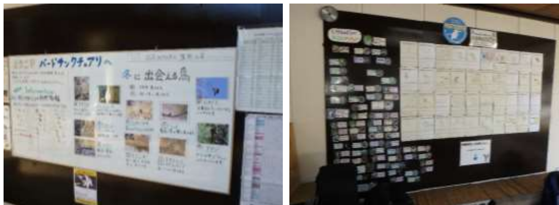
図4. 鳥の解説と『いきもの調べ』で作成された生き物のスケッチ