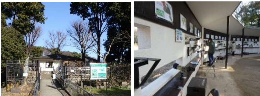
図3. 観察舎の前景と来園者の様子 (1月平日に撮影)