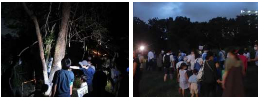
図5. 夜の観察会の様子

日中が高温になる夏季には、開園時間を16:00～21:00にずらす夜開園が行われる。夜開園の期間中は、夜間活動が活発になる生き物をテーマに特別なプログラムを企画する。令和4年度は、特別解説「街のコウモリ」で身近に生息しているもののなかなか目を向ける機会のないコウモリを、夜の観察会「樹液に集まる虫」で夜の公園の知られざる昆虫たちの暮らしを紹介した。合計5回の夜開園において動員した来場者数は1,700人を超えた。