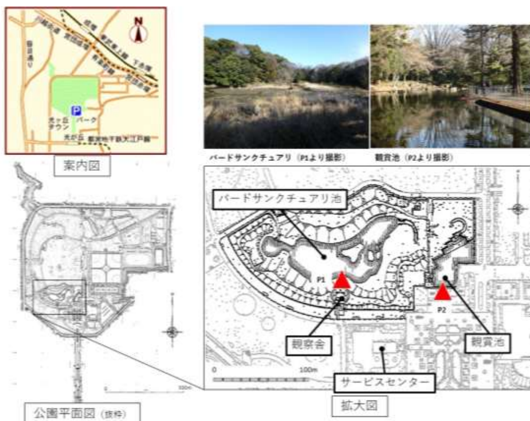
図1. バードサンクチュアリ及び観賞池の位置図

都立光が丘公園は米軍住宅の跡地に造成された公園で、公園管理所北側にあるバードサンクチュアリは1983（昭和58）年に整備された。中島や州浜が配された池は0.6ヘクタールの面積を有し、水生生物種の導入により多様な生き物が生息し、さまざまな野鳥を見ることができる。整備当初は野鳥誘致を目的として閉鎖管理が続けられたが、度重なる開園要望を受け1987（昭和62）年に一般公開された。現在、バードサンクチュアリは土、日、祝日および月1回の平日開園を行っており、令和4年度は年間129日間開園した。一方で、バードサンクチュアリに併設する観賞池は、光が丘公園を代表するフォトスポットとして来園者の憩いの場である。コンクリートで覆われた都会風な造りでありながらバードサンクチュアリ池と同様に観賞池にも大小さまざまな野鳥の飛来があり、多様性に富んだ生物相を有している。なお、バードサンクチュアリ及び観賞池の運営及び維持管理はNPO法人生態工房が当協会の委託を受けて行っている。本稿では、令和4年度における光が丘公園の二つの池を中心に行われた生物多様性保全の取組みについて報告する。