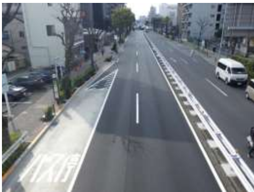
環七通り（足立区梅島）