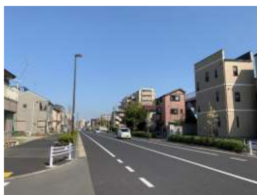
（足立区梅田四丁目付近）