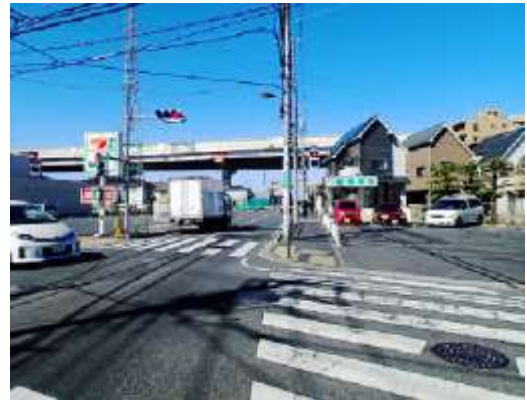
(足立区綾瀬五丁目付近)