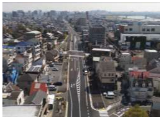
（関原・梅田その2地区空撮）