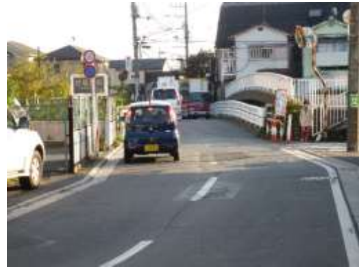
(足立区花畑七丁目付近)