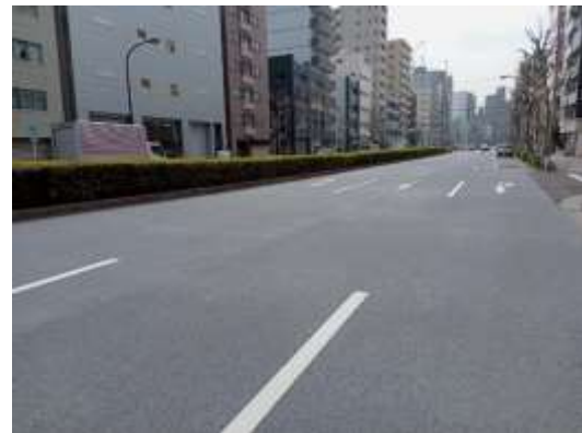
国際通り（台東区蔵前）