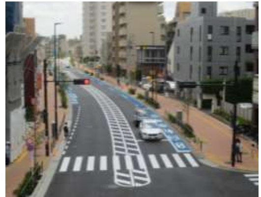
(北区赤羽西一丁目付近)