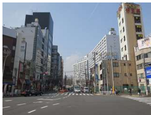
（文京区湯島三丁目付近）