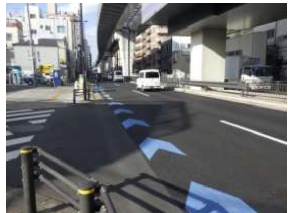
尾久橋通り（荒川区東尾久）