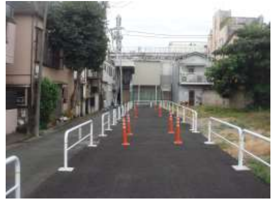
（北区十条仲原一丁目付近）