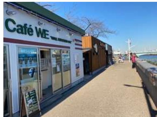
(台東区花川戸一丁目付近)

平成25年10月に2店舗がオープンし、地域と連携したイベントなどにも積極的に参加している。