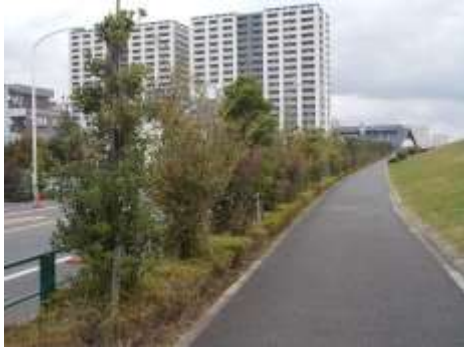
川の手通り（荒川区）