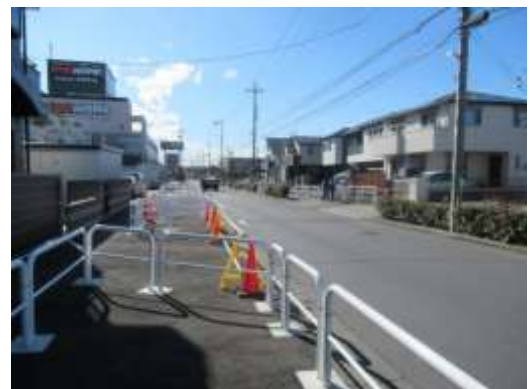
(足立区神明二丁目付近)