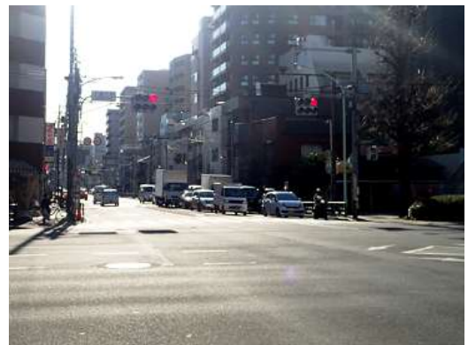
（文京区本駒込六丁目付近）