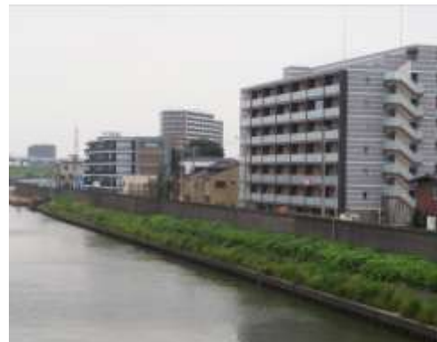
新岸川（北区志茂五丁目付近）