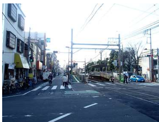
（荒川区西尾久八丁目付近）