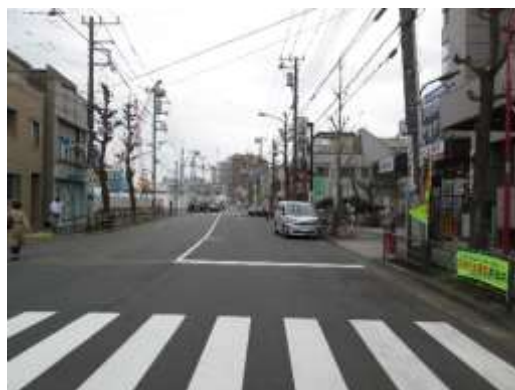
（北区上十条二丁目付近）