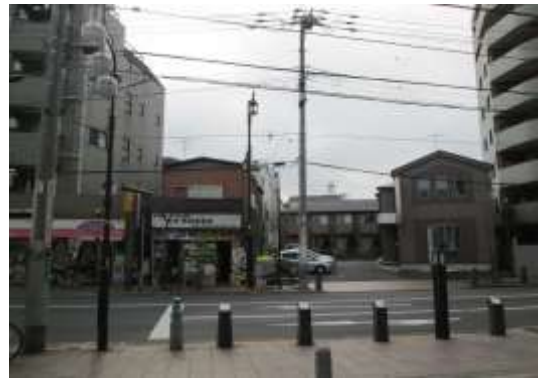
（足立区伊興四丁目付近）