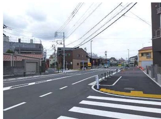
（足立区本木一丁目付近）