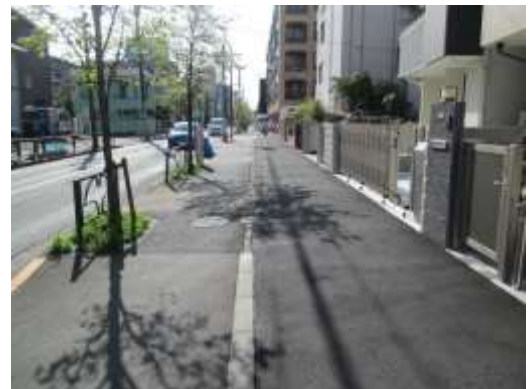
（足立区足立三丁目付近）