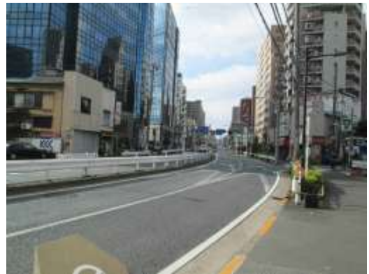
(荒川区荒川一丁目付近)