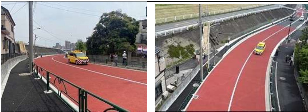
補助第 118 号線（小台）（令和 4 年 4 月 2 1 日、交通開放時）