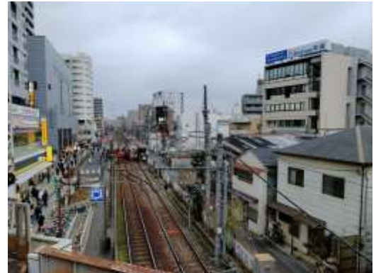
（荒川区町屋一丁目付近）