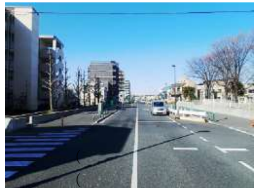
（足立区扇一丁目付近）