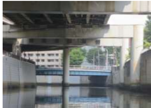
神田川（新宿区新小川町付近）