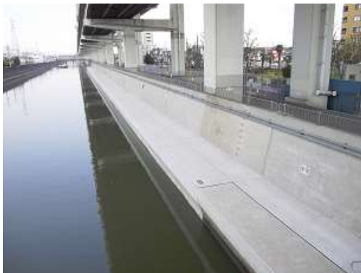
綾瀬川（足立区青井四丁目付）

令和5年度は、目標とする耐震性能は変えずに新たに整備範囲を広げた「東部低地帯の河川施設整備計画（第二期）」に基づき、新河岸川の防潮堤耐震整備工事を施工する予定である。