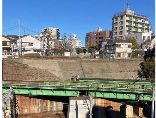
（北区田端側から撮影）