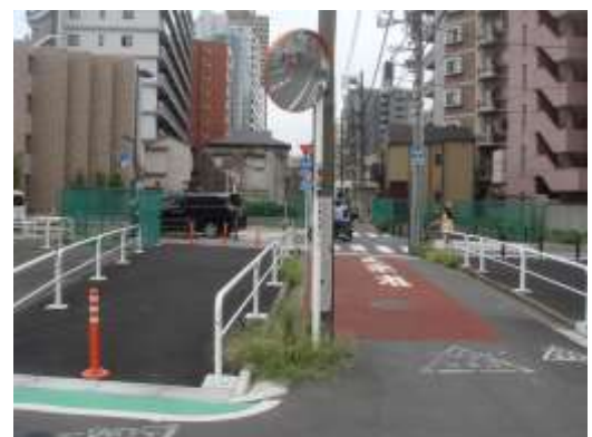
（荒川区荒川一丁目付近）