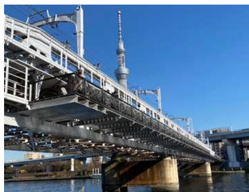
（すみだリバーウォーク）

令和2年6月に、東武線隅田川橋りょう（台東区花川戸一丁目～墨田区向島一丁目）を利用した遊歩道が設置されている。