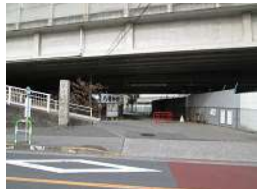
(北区赤羽台三丁目付近)