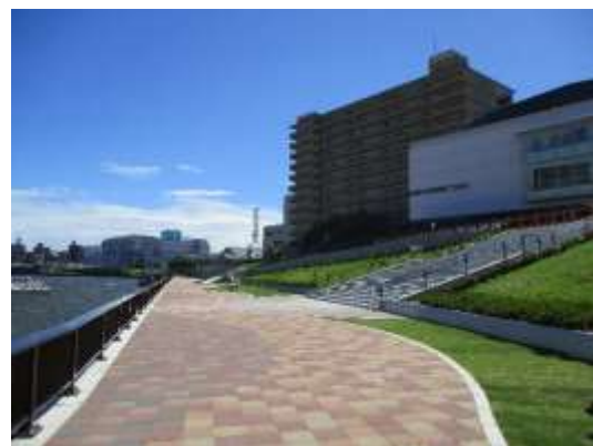
（隅田川スーパー堤防・神谷三丁目地区）

隅田川沿いでは、地震等災害に対する安全性と水辺環境の向上を図るため、沿川の再開発事業等まちづくりと一体的にスーパー堤防が整備されている。令和3年度末現在、管内で約12.2kmにわたって整備されている。