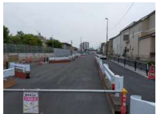
（足立区興野一丁目付近）

※以上のほか、特定整備路線には補助第136号線（本木）、（関原）、（梅田その2）がある（P.11～12参照）。