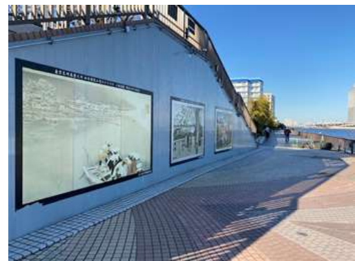
(台東区今戸一丁目付近)

東京都では、河川の賑わいの創出を目的とし、堤防壁面を利用した絵画の装飾にも取り組んでいる。