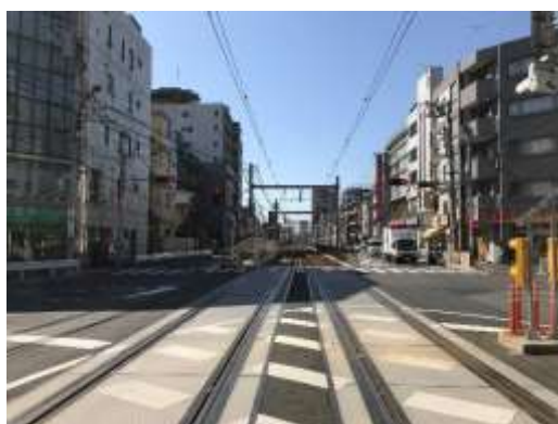
（荒川区西尾久六丁目付近）