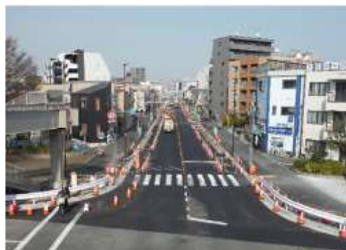
（北区豊島二丁目付近）