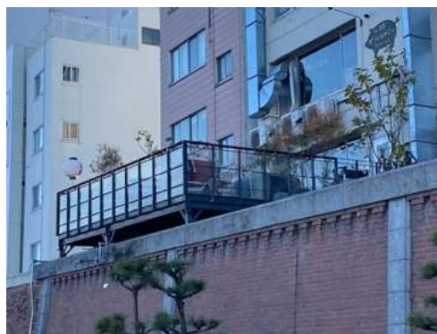
（台東区駒形二丁目付近）