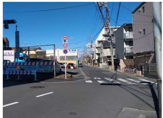
（足立区北加平町付近）