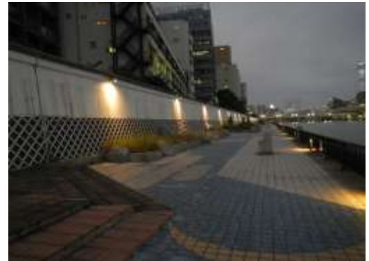
隅田川右岸テラス (台東区柳橋一丁目付近)

平成28年度から言問橋～白鬚橋間の照明施設設置に着手し、令和2年度に設置を完了した。