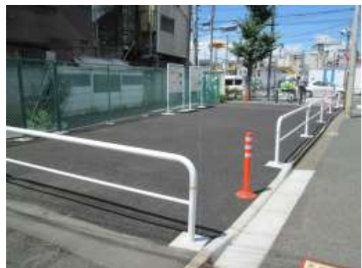
（北区上十条二丁目付近）