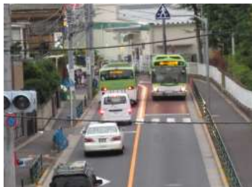
（北区赤羽台二丁目付近）