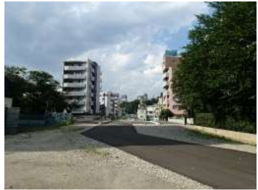
（新宿区西早稲田一丁目付近）