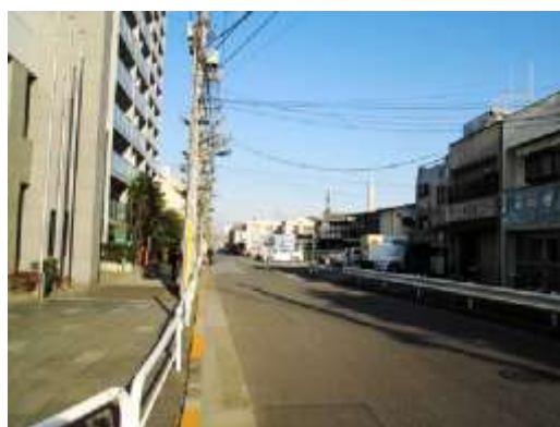
（北区赤羽南一丁目付近）