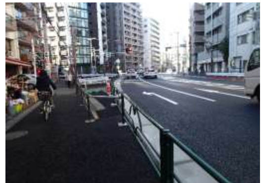
（文京区根津一丁目付近）