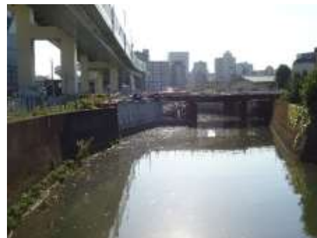
石神井川（北区堀船二丁目付近）