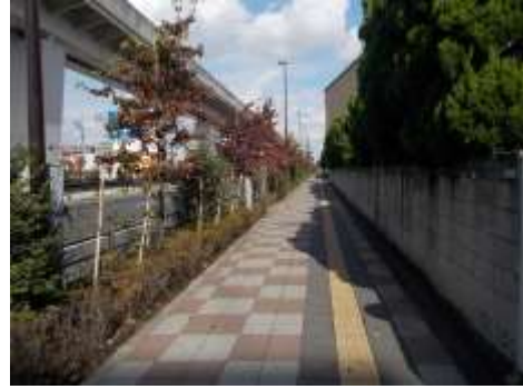
尾久橋通り（足立区）