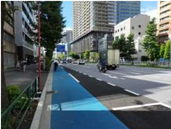
白山通り（文京区小石川）