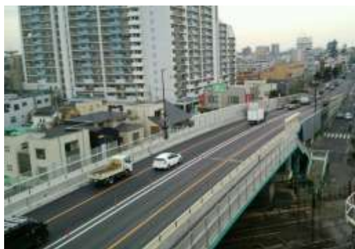
(平成29年11月4日 規制解除)