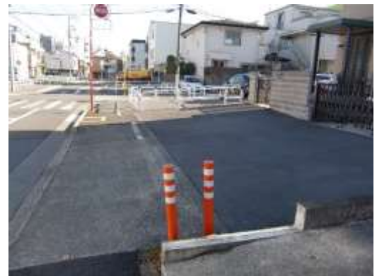
（北区赤羽西四丁目付近）