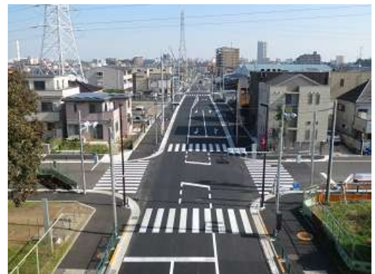
(足立区古千谷一丁目付近)