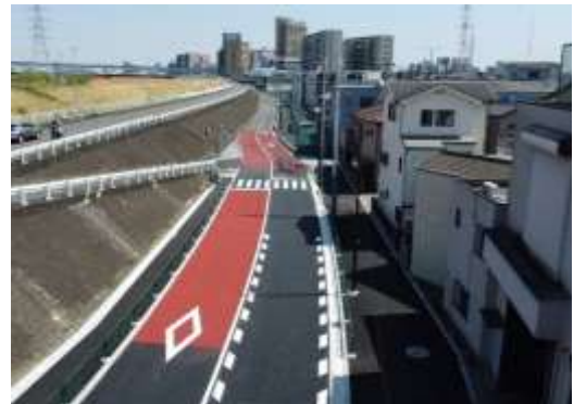
（足立区小台一丁目付近）