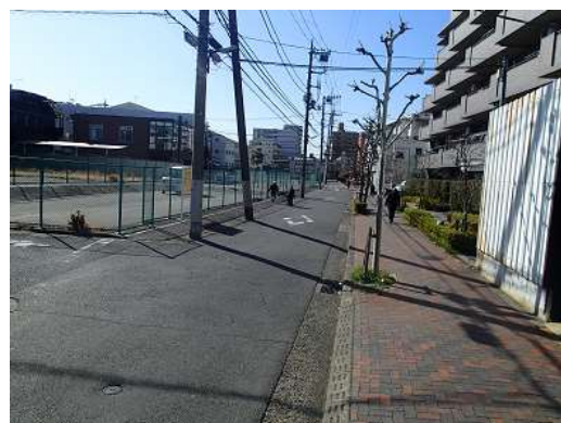
（足立区中央本町二丁目付近）