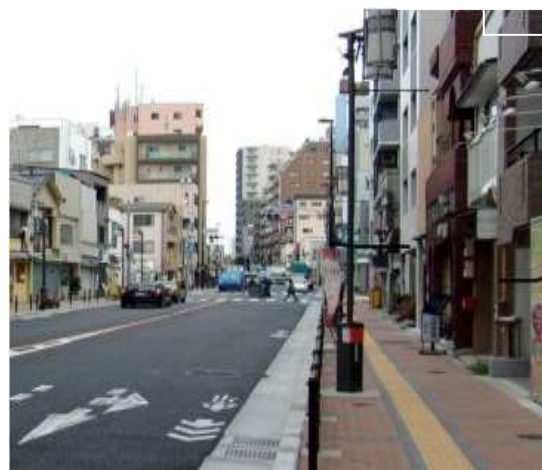
特458 白山小台線（北区田端一丁目）