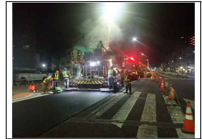
活用状況（※写真の説明以外）

道路を利用する方々の安全と快適を最前線で維持管理する技術者として、社会に貢献する喜びと誇りを持って仕事に取り組んでいただきたいと思います。