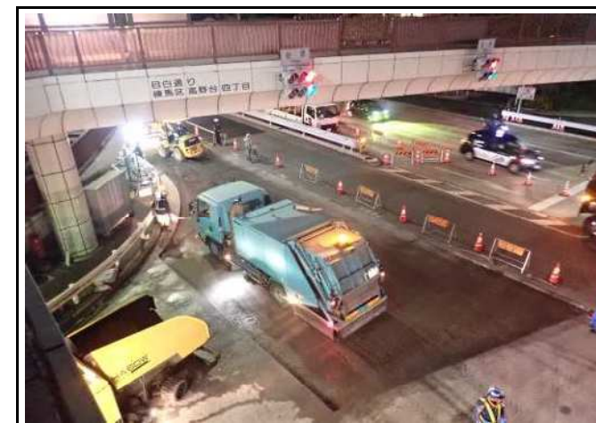
交差点内分割施工状況

「地図に残る仕事」に直接携わる事が出来るのは魅力的だと思います。様々な苦労はありますが、社会貢献ができるやりがいのある仕事です。