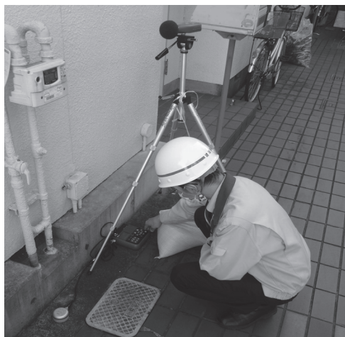
道路交通騒音調査

道路交通に伴う振動や騒音が発生することがある。実際にどの程度の振動や騒音が発生しているのか、振動計や騒音計を使用して測定し、改善に向けた技術的な支援を行っている。