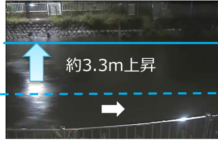
9/22 23:14頃 約3.3m上昇