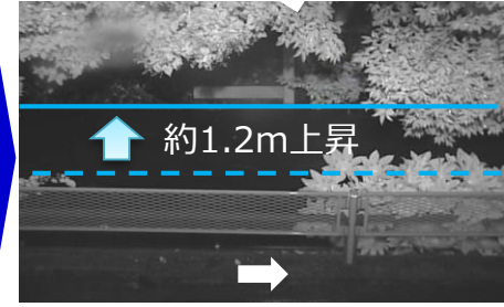
9/22 22:09頃 約1.2m上昇