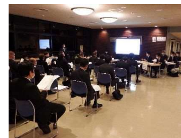
葬儀会社との意見交換