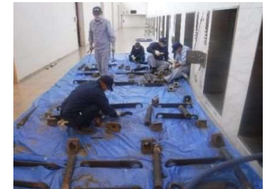
ロストル交換作業