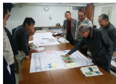
図面を基に改修計画について検討