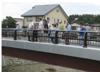
前期現場見学会（唐犬橋）