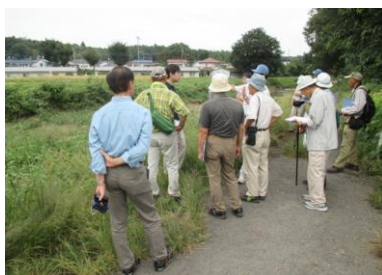
現場見学会に参加