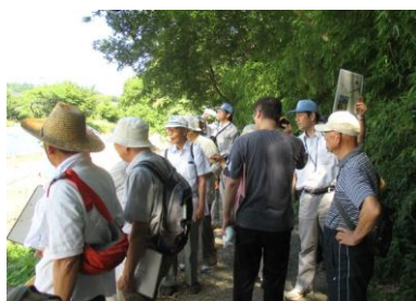
現場見学会に参加