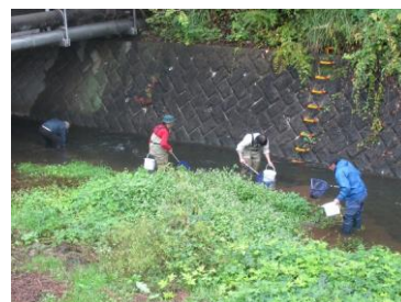
生き物調査を実施