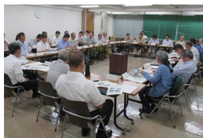
浅川流域連絡会全体会