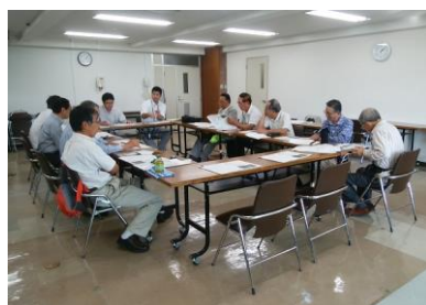
環境に配慮した川づくり分科会

2) 川口川唐犬橋上流部整備予定箇所について、計画図面を基に要望・質問を提示し意見交換を行うとともに、「河川改修計画に対する提案と成果一覧表」を作成した。