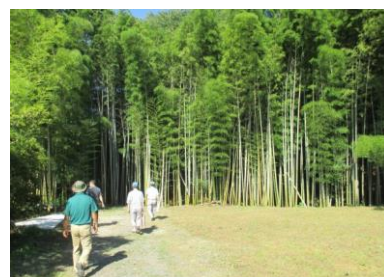
後期現場見学会（城山川）