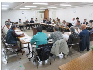
浅川流域連絡会全体会