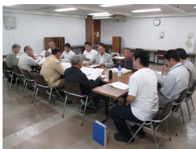
環境に配慮した川づくり分科会