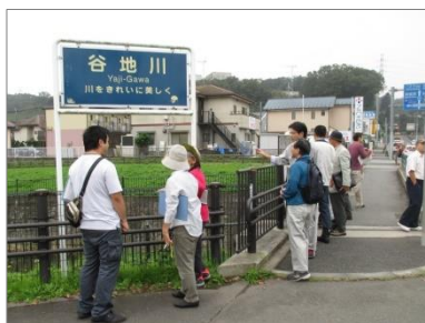
前期現場見学会（谷地川）