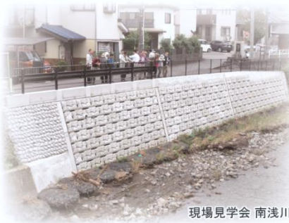
現場見学会 南浅川