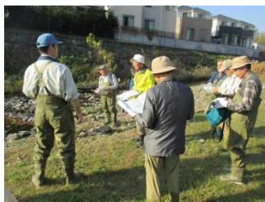
フィールドワーク（出羽橋下流）