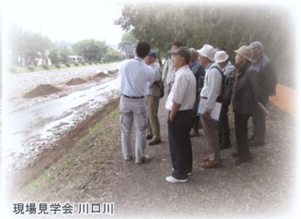
現場見学会 川口川