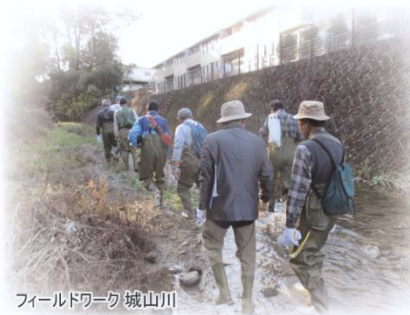
フィールドワーク 城山川