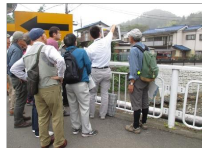
前期現場見学会（南浅川）