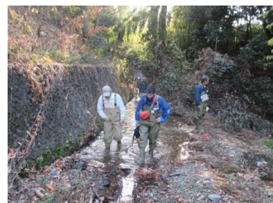
フィールドワーク（出羽橋上流）