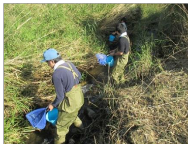
谷地川生きもの調査