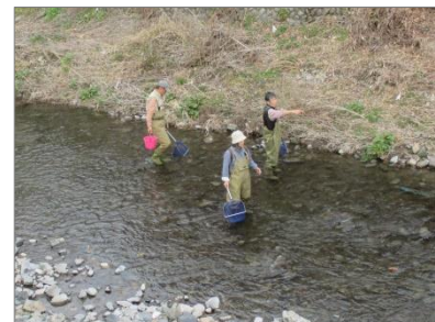
南浅川生きもの調査