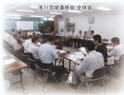
浅川流域連絡会 全体会