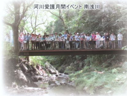
河川愛護月間イベント 南浅川