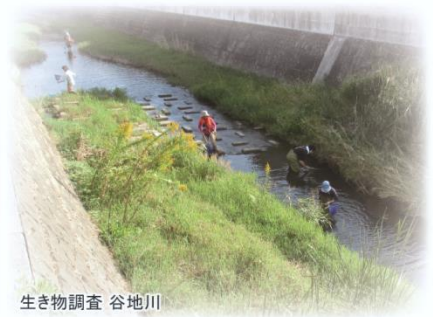
生き物調査 谷地川