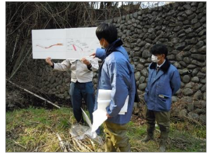
城山川フィールドワーク