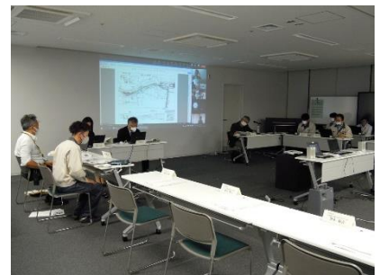
第2回全体会も対面・Web併用で開催