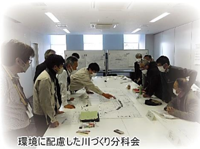
環境に配慮した川づくり分科会