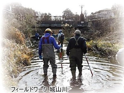
フィールドワーク 城山川

浅川流域連絡会は、平成20年3月に第1期が設立され、今年度に第8期を迎えました。 流域住民や市民団体、関係自治体が一体となり、 1期2年間の活動で、「清らかな自然と悠久の歴史を背景にした川づくり」をテーマに、 浅川水系13河川に、生活圏を共にする谷地川、程久保川、大栗川、大田川を加えた 17河川を対象に、魅力ある川づくりを目指しています。