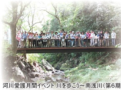
河川愛護月間イベント 川を歩こう～南浅川(第6期)