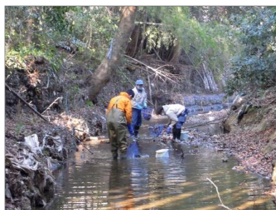
城山川出羽橋上流生きもの調査