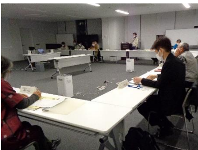
第1回全体会はマスク着用で座席間隔をあげ、行政委員はオンラインで参加