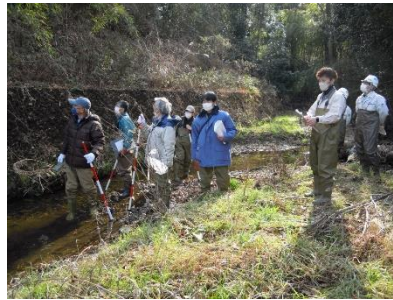
城山川フィールドワーク