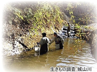
生きもの調査 城山川