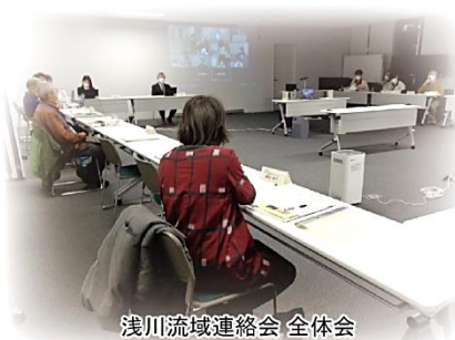
浅川流域連絡会 全体会