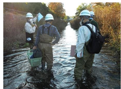
川口川フィールドワーク