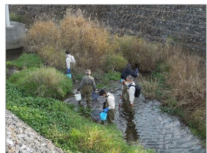
川口川生きもの調査