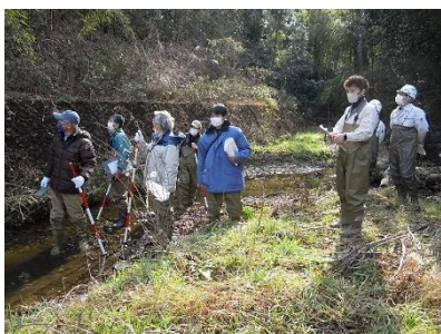
城山川フィールドワーク