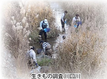
生きもの調査 川口川