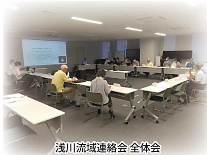
浅川流域連絡会 全体会