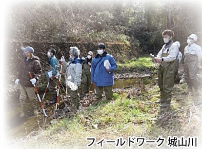
フィールドワーク 城山川