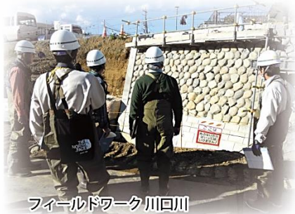
フィールドワーク 川口川

浅川流域連絡会は、平成20年3月に第1期が設立され、昨年度に第8期を迎えました。流域住民や市民団体、関係自治体が一体となり、1期2年間の活動で、「清らかな自然と悠久の歴史を背景にした川づくり」をテーマに、浅川水系13河川に、生活圏を共にする谷地川、程久保川、大栗川、大田川を加えた17河川を対象に、魅力ある川づくりを目指しています。