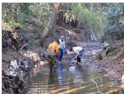
城山川生きもの調査