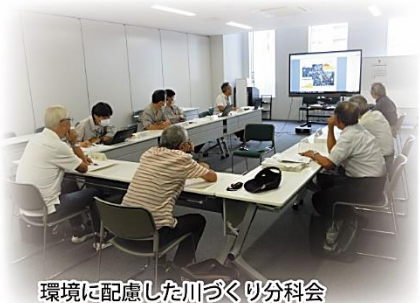
環境に配慮した川づくり分科会