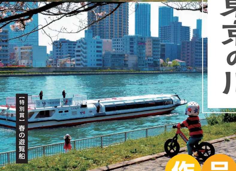
「特別賞」春の遊覧船