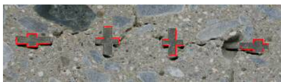
写真-3 プラ・スターGを埋め込んだコンクリート供試体の切断面 ※赤線部がプラ・スターGの断面

写真-2 ドーナツ型プラスチックスペーサを埋め込んだコンクリート供試体の切断面 ※赤線部がドーナツ型プラスチックスペーサの断面