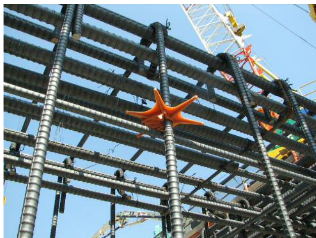
写真-1 プラ・スターGの地中梁最外部筋（縦筋）への装着状況