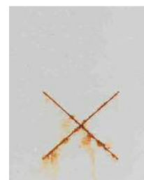
④エポオールスマイル