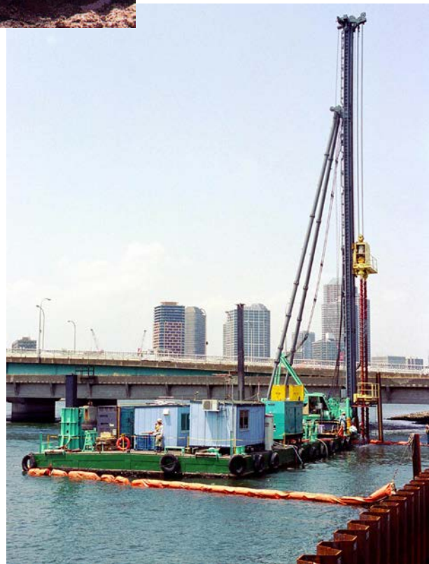
WH J 施工機全景