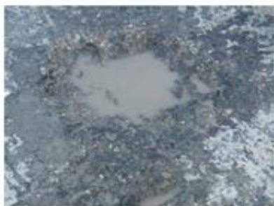
施工前（水で満たした状態）