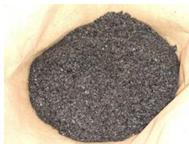
混合物(骨材の最大粒径5mm)