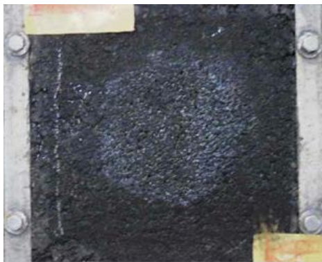
レスキューパッチ：良好状態を維持