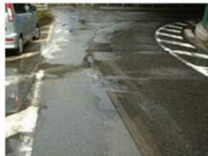
供用2ヶ月時点（雨天時）

施工性：開封前にほぐした方が施工しやすい。転圧道具に材料が付着することがあるので、付着防止材として水を使用することにより付着しなくなる。その他施工性に問題はない。