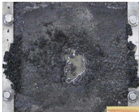
従来品：骨材の剥奪、流動