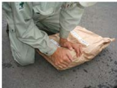
開封前に軽くほぐすと 施工しやすい

都内環状7号線において、悪条件下（地下水位が高い（常時滞水状態）、トレーラー、コンテナ車などの大型車交通量が多い、過去に何度も繰返し補修している箇所）で施工したレスキューパッチの耐久性を評価した。