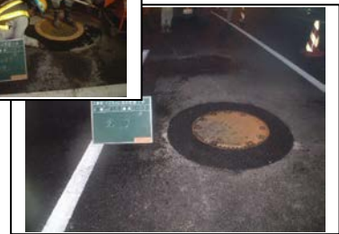
表層完了(開粒度:テクノパッチ)