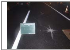
5) オフセット落とし