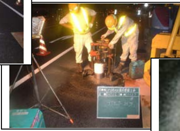
6) 開口蓋芯コアカッター工