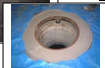
内部仕上がり状況