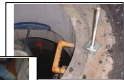
10) 固定ボルト設置工