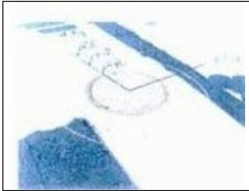
実証試験の測点の断面位置及び路面変化量