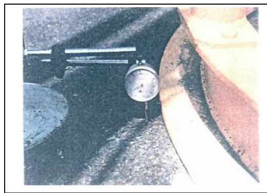
ゲージの読み -5～-20/1,000mm沈下する。