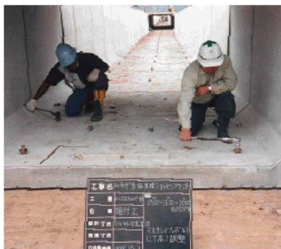
③ 市販のレンチ等を使用してマルチレベル治具 I を回す事により、上下の高さ調整作業を行う