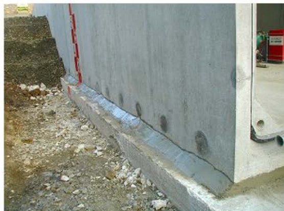
⑤ 高さ調整等により出来た、底版とコンクリート二次製品の空隙にドライモルタルにて間詰を行う