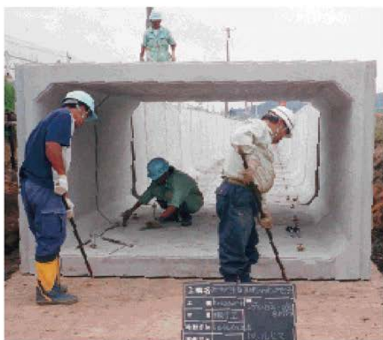
④ 市販の大型バール等を使用し、てこの原理を応用してスライドベース上を動かし、左右の位置調整作業を行う。