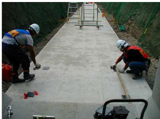
① 基礎コンクリート上での墨出作業及びスライドベース設置作業