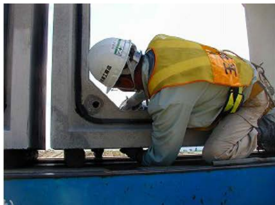
② 搬入車輛上でコンクリート二次製品にマルチレベル治具 I II の取付