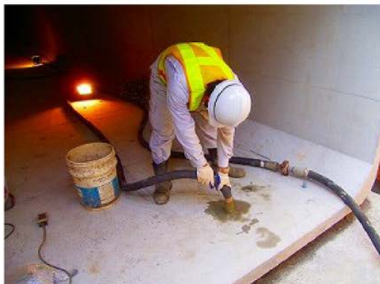
⑥ 圧入ポンプを利用したのグラウト充填作業生モルタル (1 : 2)