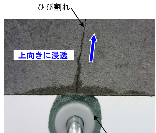
写真1：アルファテック 380 浸透状況（上向き）