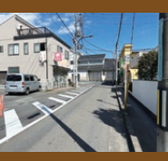
終点→起点(奥の建物が羽村駅)

正解は②約50m 一般道羽村停車場線(第167号)は、JR青梅線羽村駅と一般道羽村瑞穂線(第163号)をつなぐ路線であり、その延長は55mで都道では最も延長が短い路線です。鉄道駅や港と、近くの主要道路を結ぶ「〇〇停車場線」と名前の付く路線は、延長が短いことが多いです。