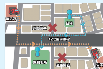
緊急車両等の通行路及び避難路の確保

問合せ先 特定整備路線に関する動画はこちら! 道路建設部街路課 TEL:03-5320-5346 用地部用地課 TEL:03-5320-5214