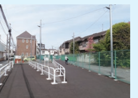
事業用地の有効活用(避難路等の確保)(補助第172号線(豊島区長崎))