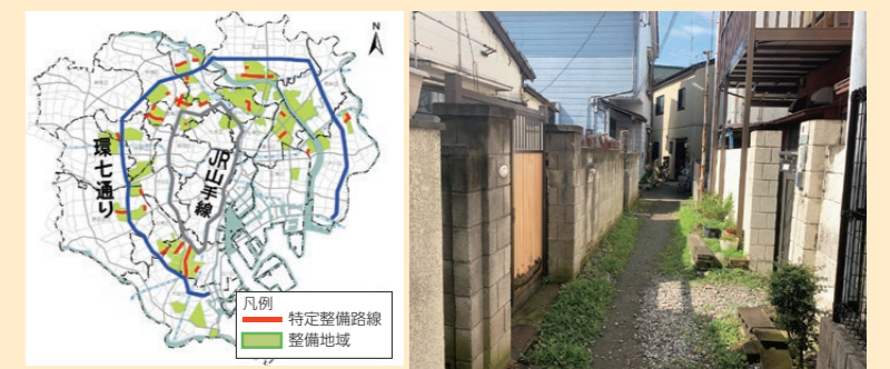
震災時に特に大きな被害が想定される木密地域(整備地域 約6,500ha(緑色箇所))

東京には、JR山手線の外側から環七通り沿いに木造住宅密集地域(木密地域)が広範囲に分布しており、次のような課題を抱えています。 ・老朽化した木造住宅が多いことなどから、地震火災など大きな被害が想定されています。 ・狭い道路や行き止まり道路が多いことなどから、消防活動等に支障をきたすおそれがあります。