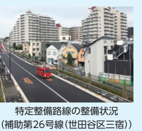
特定整備路線の整備状況(補助第26号線(世田谷区三宿))